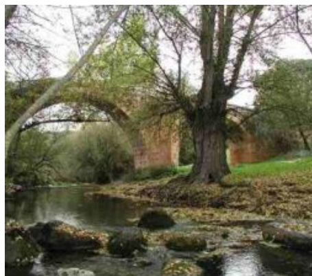
Panorámica desde Peñarrubias, puente y fuente de Covatillas